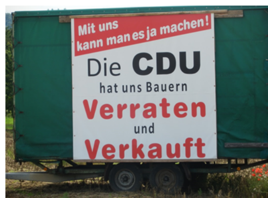
Bauernprotest auf der Gemarkung Renchen-Ulm im Juni 2015

Ein Großteil von Bürger*innen, vor allem diejenigen, die sich aktiv in die Politik einmischen, fühlen sich im besten Fall nicht ernst genommen und im schlechtesten Falle verschaukelt. In dieser immer wieder von der Politik vorgeführten Logik einer "strategischen Beruhigung" liegt die Wurzel, welche die eingangs erwähnten Protestbewegungen nährt und lässt darüber hinaus deutlich erkennen, dass es auch in einer Demokratie um Herrschaft- und Machtverhältnisse geht. Die Vorgehensweise der verantwortlichen Volksvertreter könnte den Eindruck einer verfassungsrechtlich zwar legalen, aber gegen die Rechts- und Demokratieidee gerichtete Politik erwecken. Glaubt heute noch jemand daran, dass realiter verantwortliches und vernünftiges Regieren den Missbrauch der Macht ausschließen möchte? Das Demokratieprinzip in den westlichen Verfassungsstaaten sollte jedenfalls verhindern, dass die Kontaktsysteme der politischen Führung das Volk als Ganzes nach Bedarf ein- und auskuppeln.