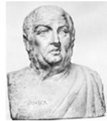
Lucius Annaeus SENECA 4 v. Chr. – 65 n. Chr.

"Manche Gesetze sind nicht niedergeschrieben, aber gültiger als alle niedergeschriebenen." 18